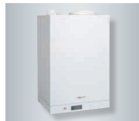
Котел Vitodens 111-W со встроенным 46-литровым емкостным накопителем