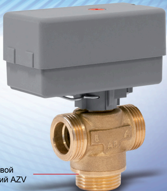
Клапан 3-ходовой переключающий AZV