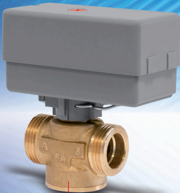
Клапан 2-ходовой запорный AZV