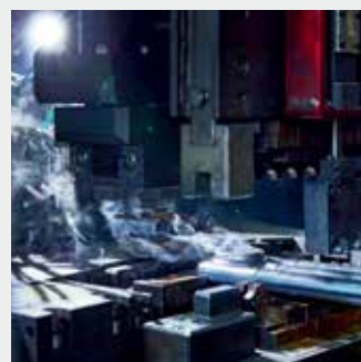
Сварка коллекторов с трубами