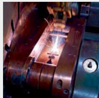
Лазерная сварка коллекторов