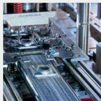
Точное изготовление половинок коллекторов