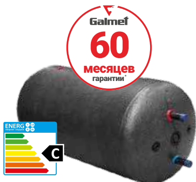
Фото 3 U-LINEA 200-300 в черной пенополистирольной изоляции

Для водонагревателей рекомендуется использовать ТЭНы марки Galmef.