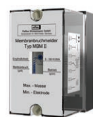
Реле Устанавливается на стене (монтаж на месте)