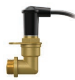
Электрод Устанавливается на заводе