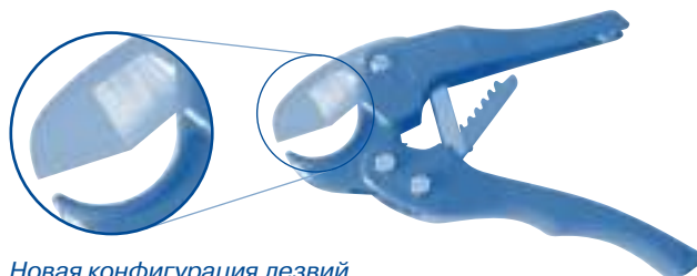
Новая конфигурация лезвий

Рекомендуем использовать новые ножницы Profi. Благодаря новой конфигурации ротора с ножницами стало проще. Этими ножницами можно резать все типы труб Ekoplastik.