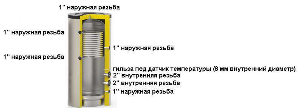
Схема бака серии AT Electro MONO