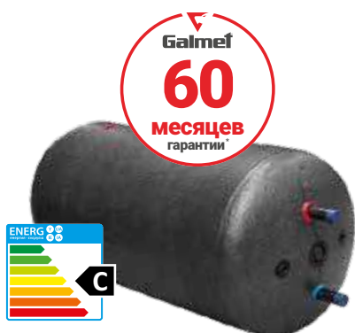
Фото 3 U-LINEA 200-300 в черной пенополистирольной изоляции

Для водонагревателей рекомендуется использовать ТЭНы марки Galmet.