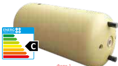
Фото 1 U-LINEA в желтой пенополиуретановой изоляции