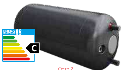
Фото 2 U-LINEA в черной пенополистирольной изоляции