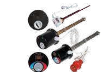
Фото 4 Электрические комплекты GE (ТЭНы)

* Гарантийные обязательства указаны в гарантийном талоне.