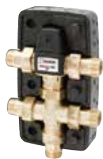
VTR300 Наружная резьба

Настоящий продукт разработан для использования в системах санитарной горячей воды.