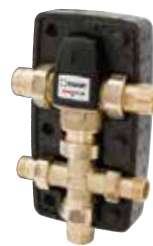
VTR500 Наружная резьба