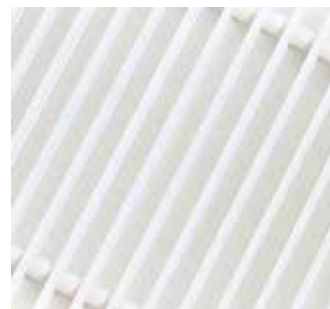
Белый (RAL 9016)