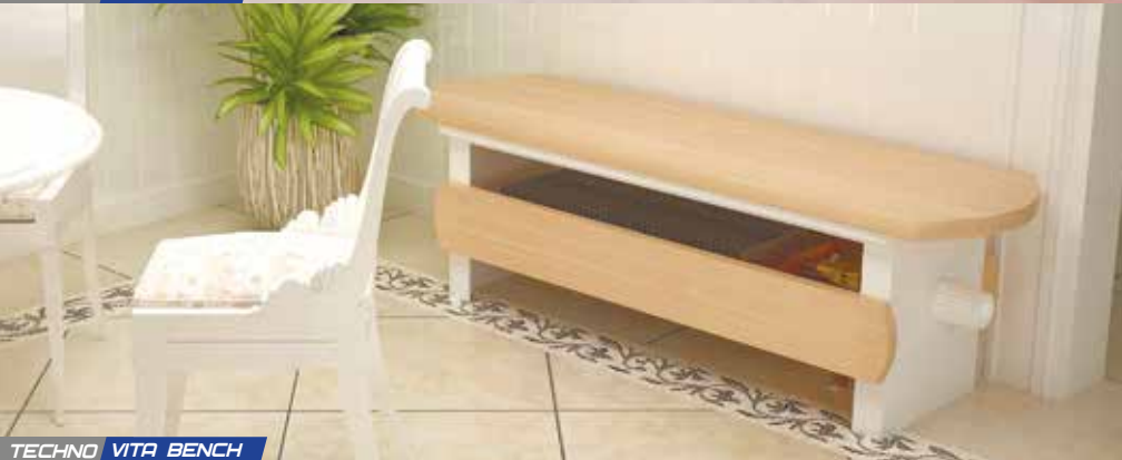
TECHNO VITA BENCH