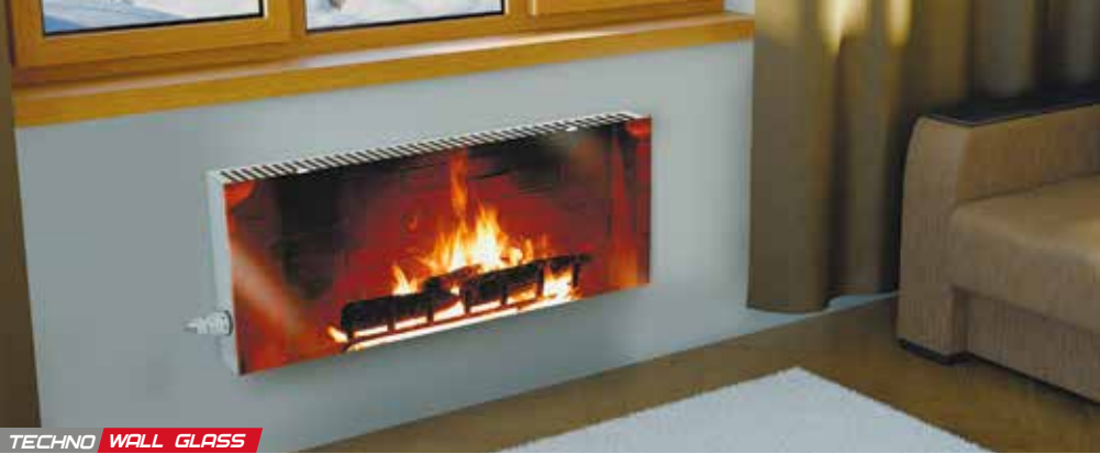
TECHNO WALL GLASS