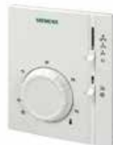
Термостат Siemens RAB 11.1