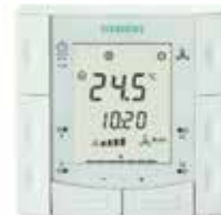
Термостат Siemens RDF 310.2