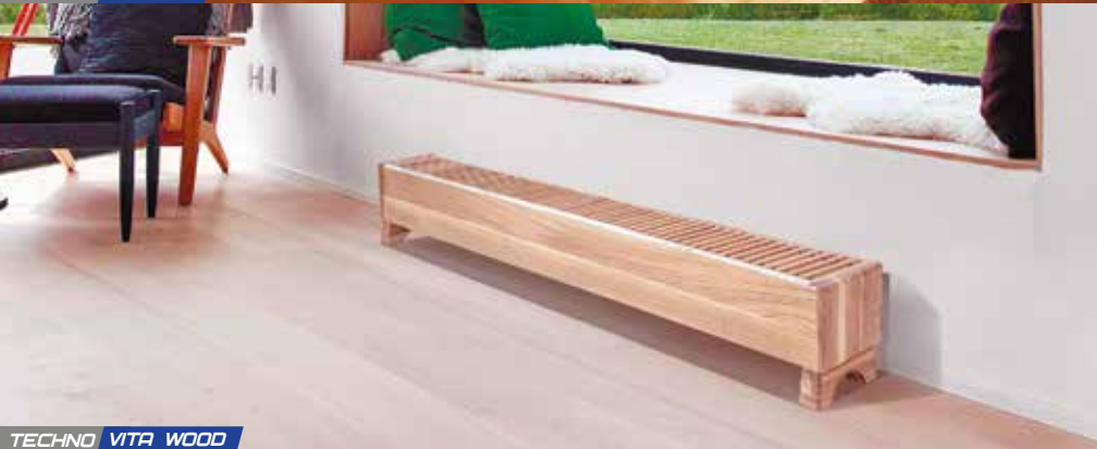
TECHNO VITA WOOD