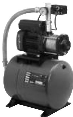
Рис. 47. Внешний вид установок повышения давления СМВ