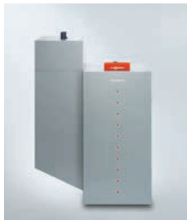
Vitoligno 300-P от 4 до 48 кВт