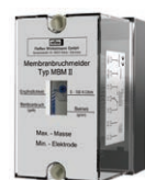
Реле Устанавливается на стене (монтаж на месте)