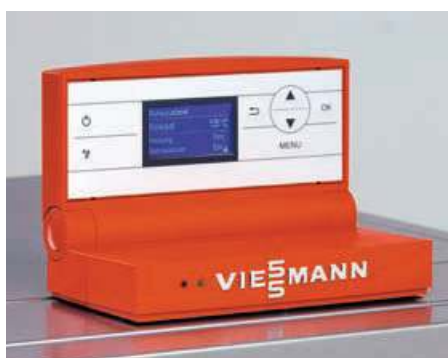
Система управления Vitotronic – большой полнотекстовый дисплей