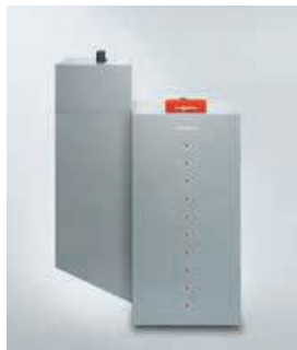
Vitoligno 300-P от 4 до 48 кВт