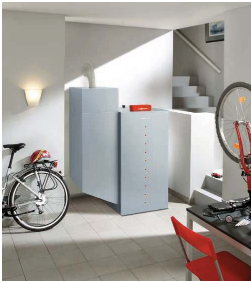
Vitotigno 300-P от 4 до 48 кВт