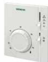
Термостат Siemens RAB 11.1