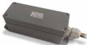
Блок Techno BT-500