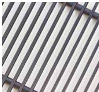
Черный (RAL 9005)