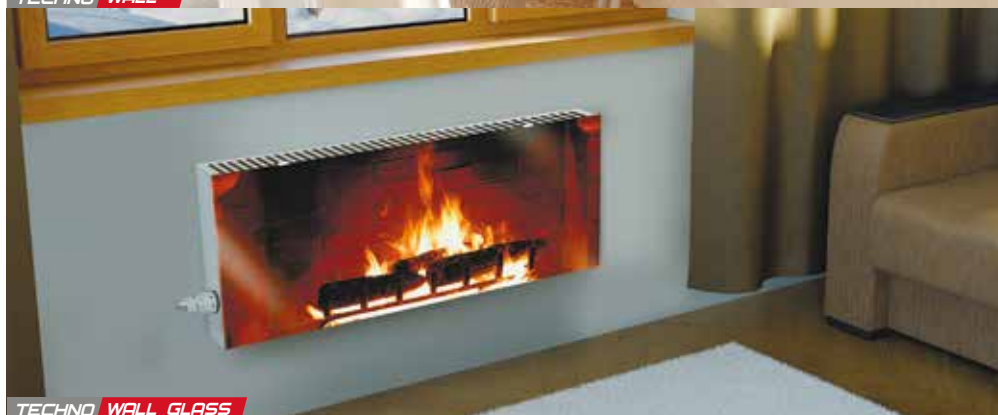
TECHNO WALL GLASS