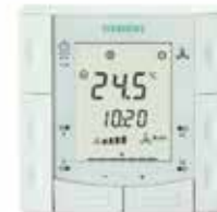
Термостат Siemens RDF 310.2