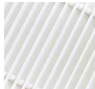
Белый (RAL 9016)