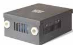
Блок Techno BRT-90

В качестве дополнительной опции для конвекторов с принудительной конвекцией мы предлагаем 3 модели блоков регулировки и 3 модели термостатов для управления скоростью вращения вентиляторов и температурой в помещении.