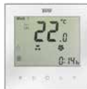
Термостат Techno KT 200