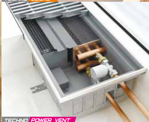
TECHNO POWER VENT