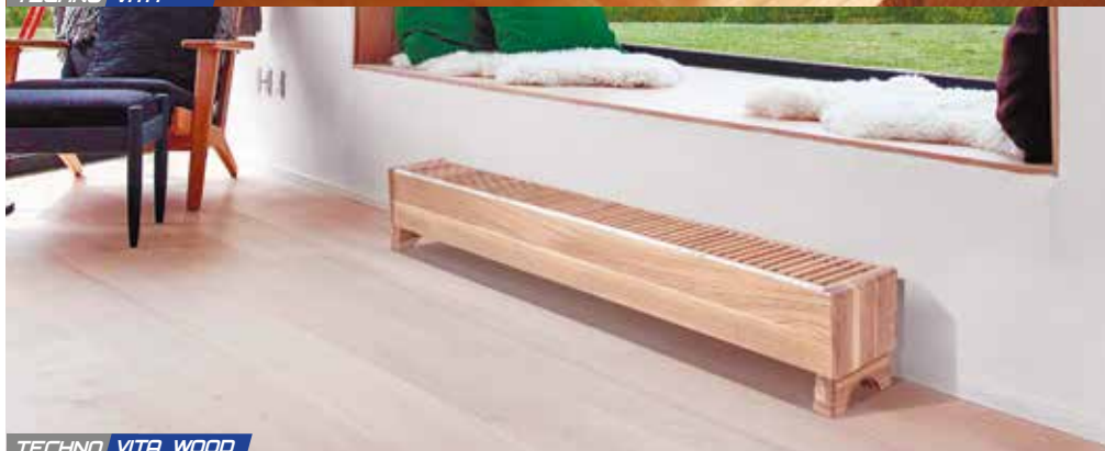
TECHNO VITA WOOD