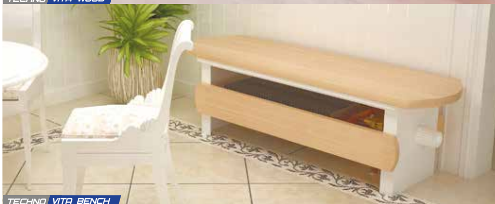
TECHNO VITA BENCH