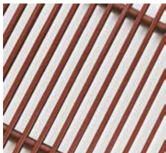
Коричневый (RAL 8017)