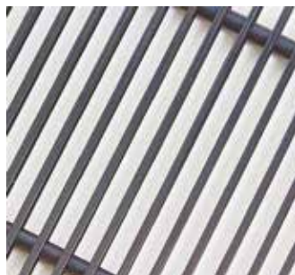
Черный (RAL 9005)