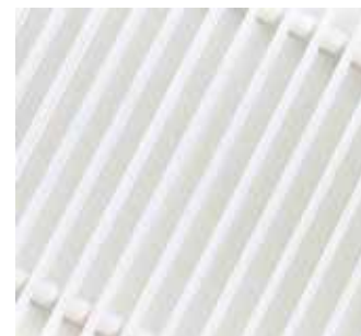
Белый (RAL 9016)