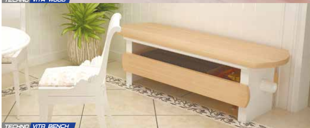
TECHNO VITA BENCH