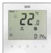
Термостат Techno KT 200