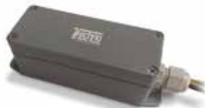
Блок Techno BT-500