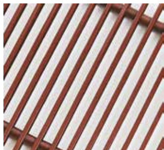
Коричневый (RAL 8017)