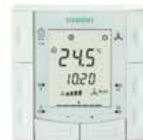
Термостат Siemens RDF 310.2