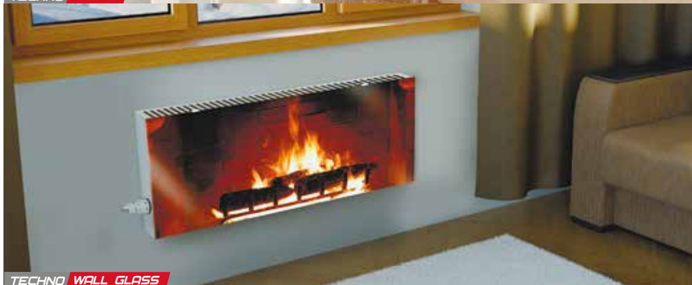
TECHNO WALL GLASS