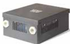
Блок Techno BRT-90

В качестве дополнительной опции для конвекторов с принудительной конвекцией мы предлагаем 3 модели блоков регулировки и 3 модели термостатов для управления скоростью вращения вентиляторов и температурой в помещении.