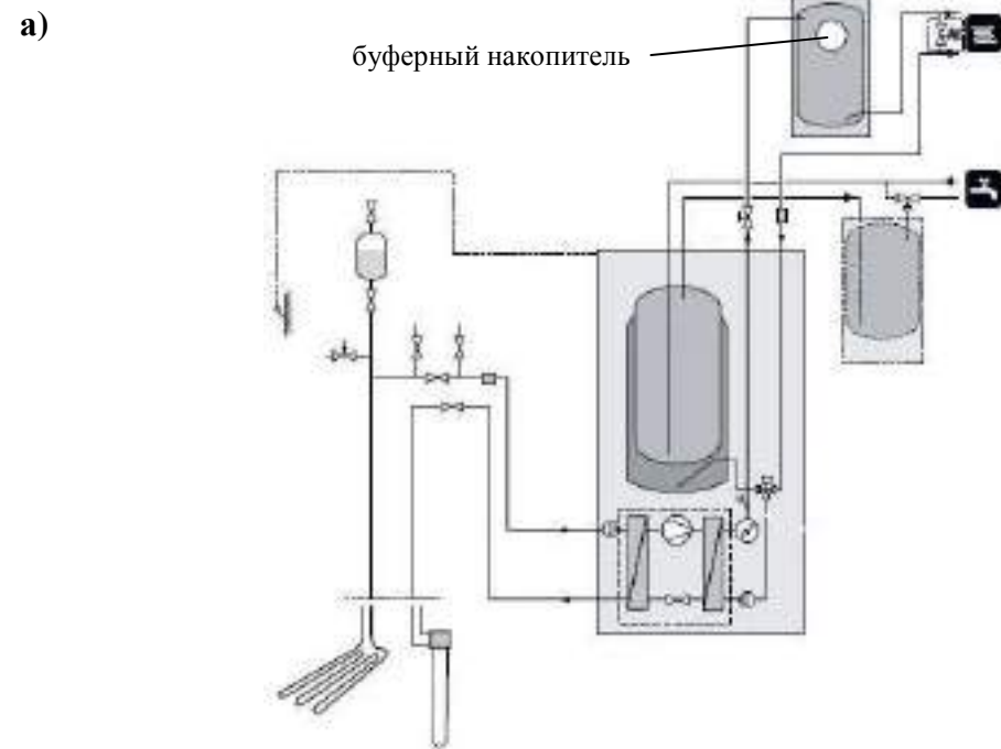
Рис. 3 Примерные схемы гидросистемы