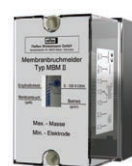
Реле Устанавливается на стене (монтаж на месте)