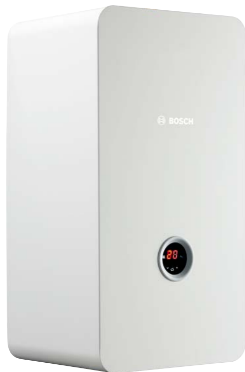
Tronic Heat 3000/3500