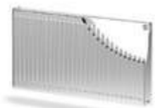
Тип 10 - P

Последняя особенность позволяет использовать такие батареи в самых разных зданиях – от обычной квартиры до больницы, детских садов и бизнес-центров.