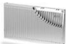
Тип 11 - PK