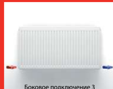
Боковое подключение 3