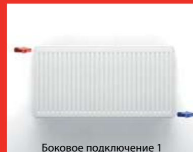
Боковое подключение 1