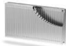
Тип 20 - PP