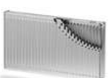
Тип 21 - PKP