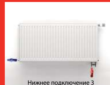
Нижнее подключение 3