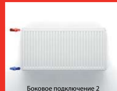
Боковое подключение 2