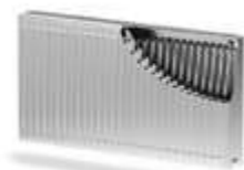
Тип 22 - PKKP