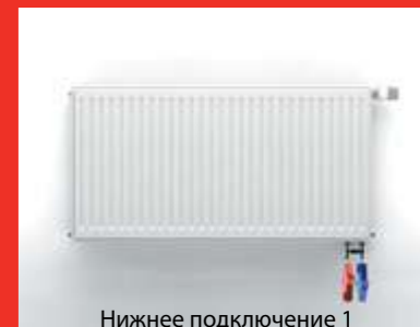
Нижнее подключение 1