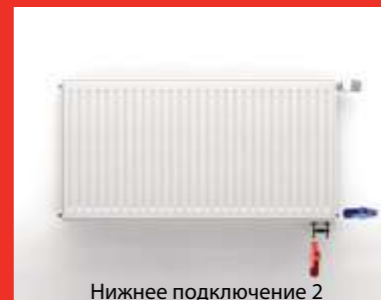
Нижнее подключение 2