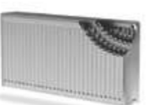
Тип 33 - PKKPK