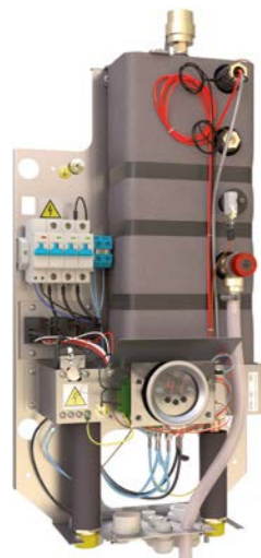
Tronic Heat 3000

* Действительно только для котла Tronic Heat 3500