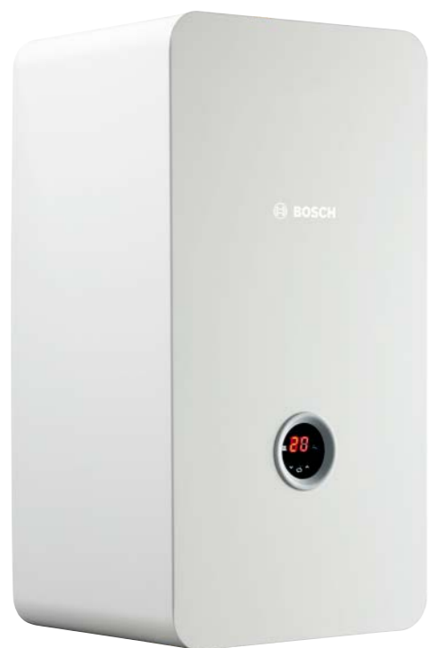
Tronic Heat 3000/3500