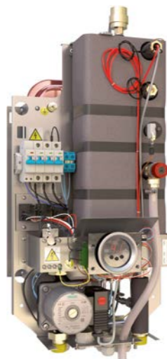
Tronic Heat 3500

ООО «Босх Термотехника» Россия, 141400, Московская область, Химки, Вашутинское шоссе, 24 Тел.: (495) 560-9065 www.bosch-climate.ru