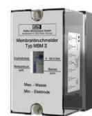
Реле Устанавливается на стене (монтаж на месте)