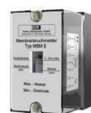
Реле Устанавливается на стене (монтаж на месте)