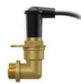
Электрод Устанавливается на заводе